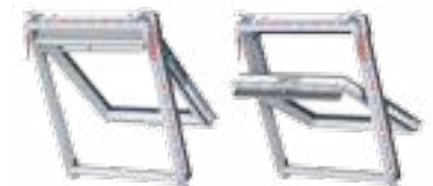
Klapp- Schwingfenster / Fluchtwegfenster